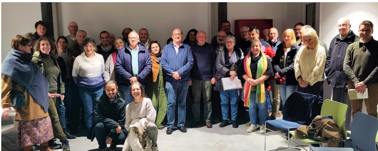
Les membres de la CLDR