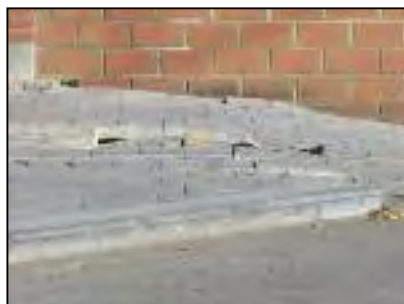
Rue Ernest Martel

Lancement de la nouvelle méthode de fauchage. Il y aura une nette différence dans l'entretien de nos talus.