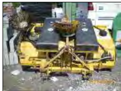
Une balayeuse hydraulique pour tracteur

Renseignements auprès de Monsieur Boudart - Chef de Bureau : 067/44 41 13.