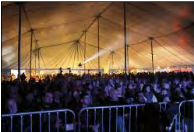
Un public nombreux et visiblement captivé