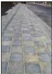
Rue Docteur Bureau

Beaucoup d'Ecaussinnois se demandent pourquoi les trottoirs sont abîmés à de très nombreux endroits. En fait, les trottoirs réalisés entre 2000 et 2006 présentent des malfaçons importantes. L'entrepreneur qui a réalisé ces chantiers s'est engagé à les réparer. Des courriers ont été échangés en ce sens. Nous devons cependant faire une vérification quant à la sous-couche présente sous le pavage. Notre surprise a été totale lorsque nous avons constaté que celle-ci ne correspondait pas au cahier des charges. Cette malfaçon devrait entraîner un remplacement total des revêtements des trottoirs. Se lancer dans une procédure judiciaire risque de durer trop longtemps. Une négociation est donc lancée afin d'obtenir un accord amiable. Le collège espère aboutir rapidement mais en attendant, tout comme pour la rue du Berseault, autre chantier lancé avant 2006, il faudra faire preuve de patience pour une résolution définitive.