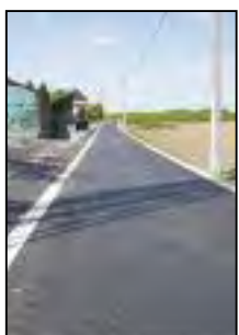
Rue du Chemin de Fer

L'objectif reste toujours d'apporter le meilleur cadre de vie possible. L'année 2010 sera très importante en matière de travaux car bon nombre de dossiers sont enfin arrivés au terme de leur très longue procédure administrative. Voici venu le temps des réalisations.