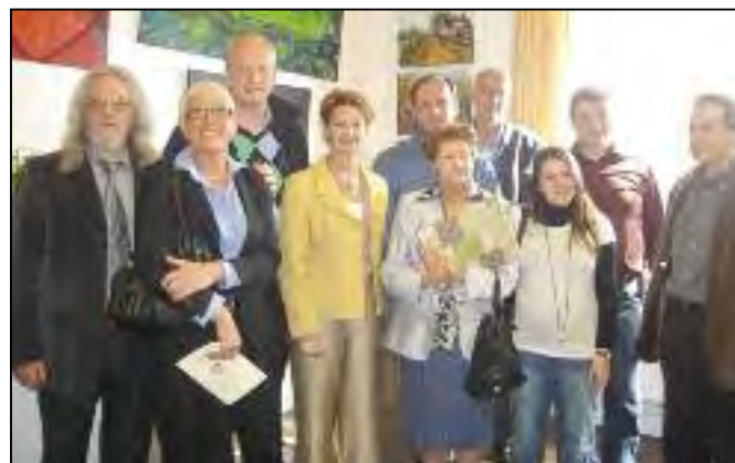
Lors de la remise des prix...