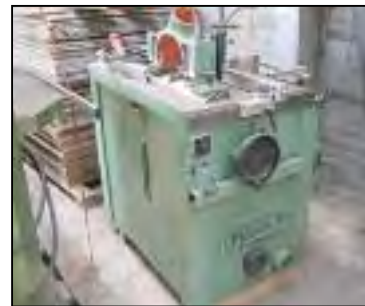
Une scie à ruban de la marque GRIGGIO SNAC 640 (220V triphasé) Un combiné scie/toupie de la marque MECHANILS ST 1000 (220V triphasé)

Cela ne nous empêche pas de faire de notre mieux.